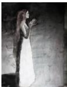
François-Xavier de Boissoudy, Marie chez elle, 2016, - lavis d'encre sur papier marouflé sur toile, 125 x 100 cm

Un ouvrage original des œuvres de l'exposition commentées par Michel-Marie Zanotti-Sorkine (aux éditions de Corlevour) sera publié pour l'événement.