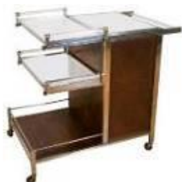
Adnet-bar roulant, 2 plateaux amovibles et compartiment verres et bouteilles, vers 1935

L'influence du Bauhaus, école dirigée par Walter Gropius puis Mies van der Rohe, malgré sa courte existence de 1919 à 1933, a été considérable. Son manifeste prône le rapprochement de l'artisanat et de l'industrie, en s'appuyant sur les nouvelles techniques ainsi que sur les nouveaux matériaux, afin de produire des objets utilitaires (bâtiments, lampes, meubles en particulier) alliant esthétique moderne et aspect utilitaire tout en étant accessible. Le modernisme français incarné notamment par l'Union des Artistes Modernes de Robert Mallet Stevens et la Compagnie des Arts Français de Jacques Adnet poursuit des objectifs similaires mais sous la forme d'une association de créateurs et d'expositions périodiques.