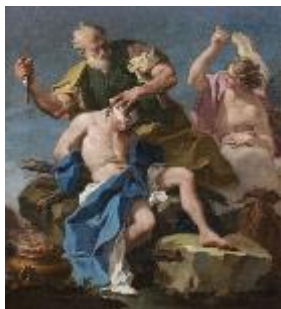
Giovanni Battista PITTONI (Venise, 1687 - 1767), Le sacrifice d'Isaac Huile sur toile – 40x40 cm