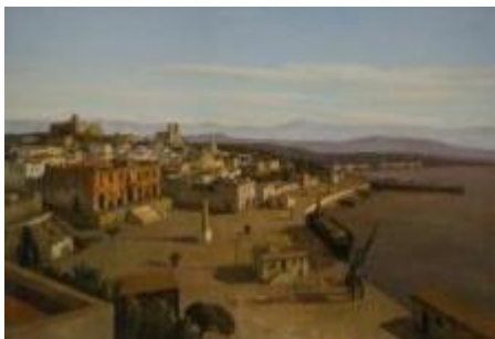
Pascal Vinardel , l'amirauté huile sur toile 89 x 156 cm

Pour l'édition 2017 de la Nocturne Rive Droite , la galerie présente une exposition de groupe. Parmi les artistes exposés : Bitman - Bouvier - Hajjima - Lapene - Shaw - Vinardel