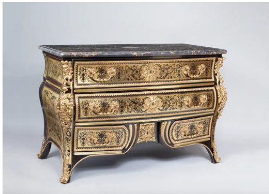
Commode en marqueterie Boulle, Epoque Régence, par François Lieutaud

En réunissant les critères d'élégance et d'excellence à la dernière pointe de la technologie, ce Voyage de Lumières est l'occasion pour les amateurs d'art de découvrir l'association de deux univers qui se complètent harmonieusement.