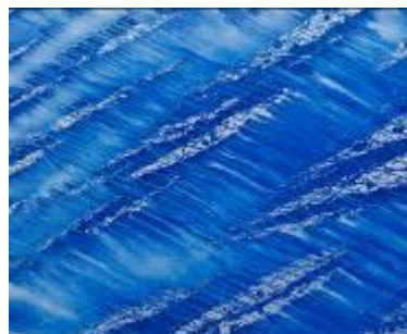
Chae Sung-Pil, Histoire bleue (170104) , 2017, Natural pigments on canvas, 130 x 162 cm