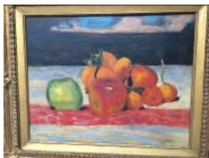
Bonnard, nature morte, fruits, ca 1942, Huile sur toile 31,5 cm x 40,5 cm

Evènement : accrochage d'artistes modernes et contemporains.