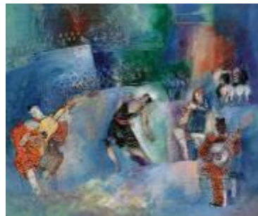
Jean Dufy, le cirque huile sur toile - 60 x 73 cm – signée et datée « Jean Dufy 27 » en bas à droite - peint en 1927