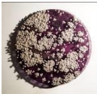
Ran Hwang, Ode to Second Full Moon BW , 2016, Paper buttons, beads, pins on Plexiglas, 100 x 100 cm

Opera Gallery a toujours été particulièrement liée à l'Asie, avec l'ouverture à Singapour en 1994 de la première galerie du réseau. A l'occasion de la Nocturne Rive Droite, elle met en avant la scène artistique coréenne.