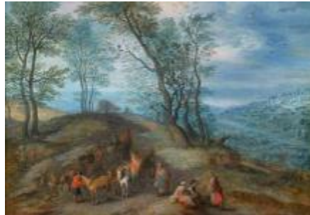
Joseph van Bredael (Anvers, 1688 – Paris, 1739), voyageurs au carrefour des routes de Flandres, huile sur cuivre 21 x 29,6 cm, signe du monogramme i.b. en bas a gauche