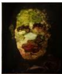
Johan Van Mullem , Sans Titre, encre sur toile, 160x140cm, 2015