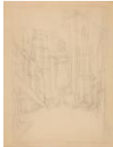
Alberto Giacometti , Annette dans l'atelier , circa 1954, dessin au crayon sur papier vélin, 65,3 x 50 cm