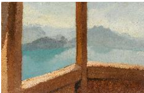
Giuseppe de Nittis (Barletta 1846 – Saint-Germain-en-Laye 1884)

Le lac des quatre-cantons depuis Rigi-Kulm , 1881 , Huile sur panneau 27 x 41 cm