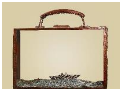
Jean-Michel FOLON (1934-2005) Partir, 2002 Bronze 248 x 298 x 78 cm