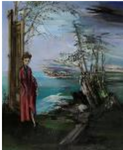
Francis Gruber , la mélancolie , 1941, huile sur toile, 100 x 81 cm

Alberto Giacometti et Francis Gruber, deux grands peintres à découvrir en parallèle. Un regard partagé sur le monde des années 1930-1945 ainsi qu'une même écriture griffée.