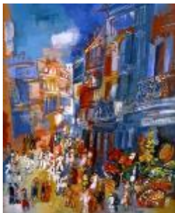
Jean Dufy, carnaval à Villefranche-sur-mer huile sur toile - 73 x 60 cm – signée et datée «Jean Dufy 27 » en bas à droite - peint en 1927

Pour l'édition 2017 de la Nocturne Rive Droite, la Galerie réserve un accrochage particulier d'œuvres de Jean Dufy.