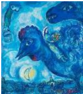
Marc Chagall, le coq bleu ou le rêve du village , circa 1958, gouache, pastel et crayon noir sur papier, 84 x 77 cm.