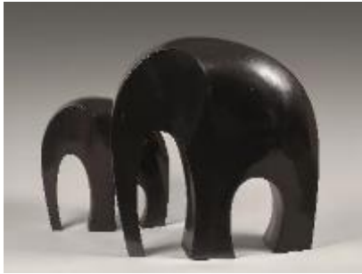
Ferdinand Parpan Elephants ,

bronzes à patine noire, signés et numérotés