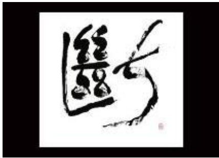
Gyokuei Miyazawa : Décision 52 x 56 cm, encre de chine sur papier japonais

Gyokuei Miyazawa est une artiste japonaise qui se consacre à développer la calligraphie dans le monde, elle expose dans différentes manifestations en Chine, Thaïlande, Portugal, Italie et Monaco.