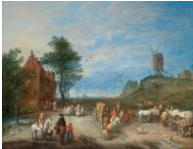
Joseph van Bredael (Anvers, 1688 – Paris, 1739) scène villageoise avec marchands, carriages et un moulin, huile sur cuivre 26 x 34 cm