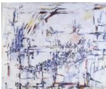
Vieira Da Silva M-H, Sans Titre , 1955, Huile sur toile, 60 x 73 cm.