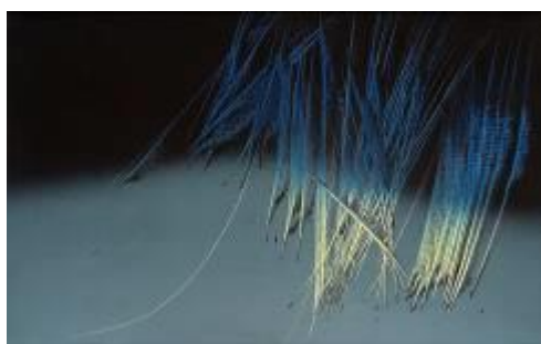
Hartung, composition 1964, huile sur toile, 65 x 103 cm